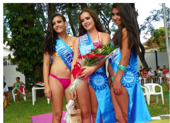
Soberanas do Concurso Adulto de 2014

Dia 08/02, domingo, a partir das 10hs, diversas atrações vão agitar a AABB, com sorteio de diversos brindes a todos que se fizerem presentes. Neste ano, novidades como a escolha do Rei e também da Mais Bela Idade das Piscinas da AABB. Inscrições ainda podem ser feitas na secretaria do clube, nas seguintes categorias: Infantil, de 5 a 10 anos, Juvenil, de 11 a 15 anos, adulto, de 16 a 20 anos e bela idade a partir dos 40 anos. Evento realizado pela ZRS Eventos em parceria com a AABB.