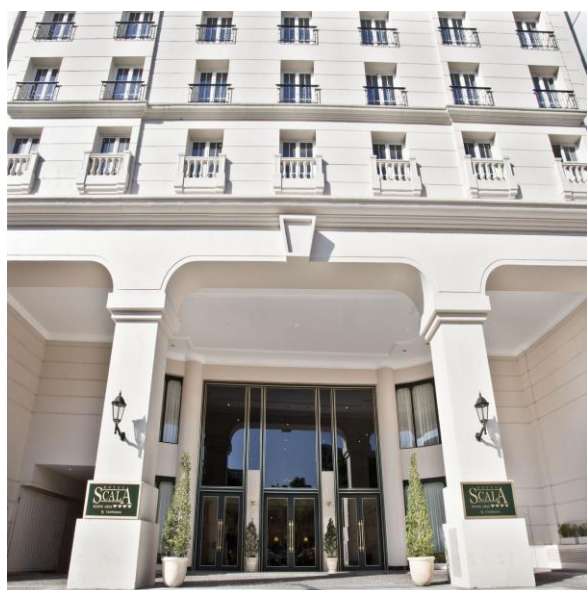
Hotel Scala by Cambrecom – Buenos Aires

com conforto no feriado de Páscoa . Saída dia 02/04/2015, quinta feira, as 19hs, de frente da AABB, 3 dias, 2 noites em Buenos Aires, com retorno/chegada as 6:30hs do dia 06/04/2015, segunda. Hotel 4 estrelas com café da manhã. Ônibus 2 andares com sala de jogos no piso inferior. Valor até 28/02/2015, R$ 700,00 para sócios da AABB e R$ 750,00 para não sócios. Valor por pessoa em quarto duplo, podendo ser parcelado até o dia da viagem. Lugares serão marcados no momento do 1º pagamento.