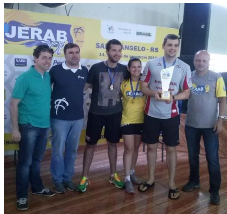
Santo Ângelo, equipe Campeã no Vôlei 4X4 misto