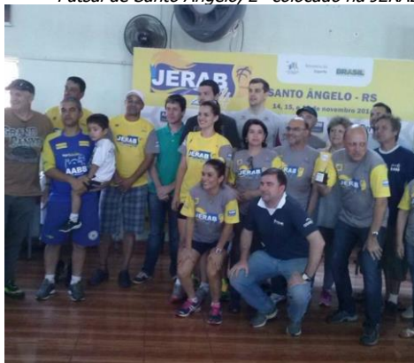
Parte de equipe que ajudou na organização da JERAB