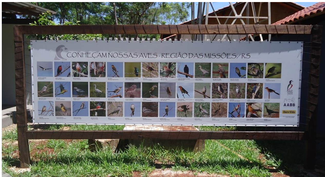
Painel educativo instalado na Sede Campestre apresentando a foto, nome e nome científico de algumas das aves (as mais comuns) existentes na região missioneira.