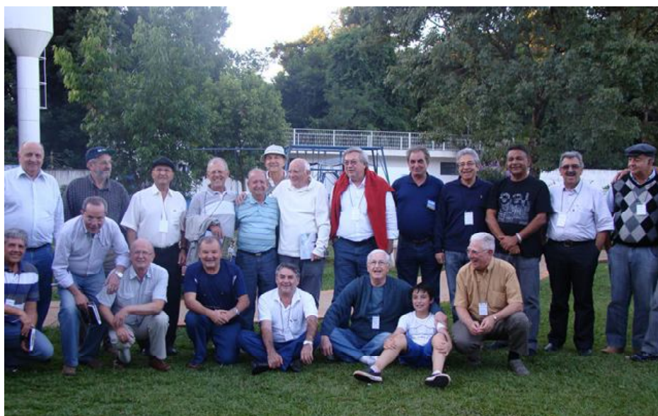
Aqui, uma parte do pessoal que esteve em Toledo em 2012

Há dois anos, a diretoria da AABB e a Administração da agência, somados com funcionários pioneiros, organizaram um evento de reencontro dos primeiros funcionários da agência BB em Toledo.