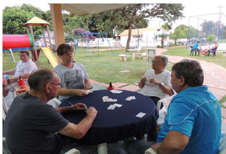
Pela luminosidade, era verão